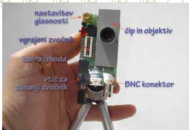
Objektiv kamere se nahaja pred silikonsko mrežnico.

Napake v mreži so pomembne - brez njih učenje namreč ni možno. Ta lastnost učenja je pogosto spregledana. Pretirano trenirane mreže, ki ne delajo napak, bi se odzivale le na eno vrsto vnosa. Takšne mreže metaforično poimenujemo „babičine mreže“ - s čimer namigujemo na analogijo s teoretično predpostavljenimi, a verjetno bolj mitskimi „babičnimi celicami“, ki naj bi se odzivale le takrat, ko vidimo babico, in naj bi pri tem nikoli ne zagrešile napake. V resničnem svetu to ni posebej uporabno, saj bi za vsako stvar, ki bi se jo naučili, potrebovali svojo mrežo. Prav nasprotno je prednost UNM v njihovi sposobnosti posploševanja odzivanja na vhodne vzorce, tudi na tiste, ki jim v postopku učenja nikoli niso bile izpostavljene. Sposobne so videti odnose, zajeti asociacije in odkriti zakonitosti v vzorcih. Ob tem pa so odporne na napake – prav tako kot pravi možgani. Shranjeni vzorec so sposobne obnoviti, tudi kadar je vhodni vzorec nepopoln ali mu je prištet šum. To so zelo pomembne lastnosti bioloških možganov, ki jih izkazujejo tudi UNM.